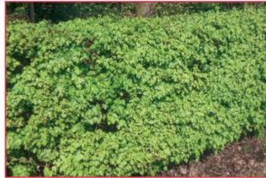
Acer campestre - Veldesdoorn