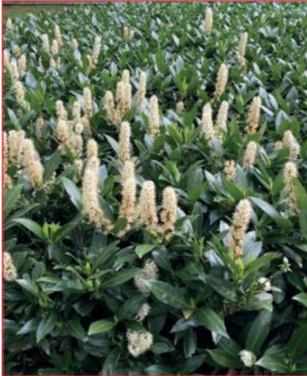
Prunus laurocerasus 'Otto Luyken' Laurierkers