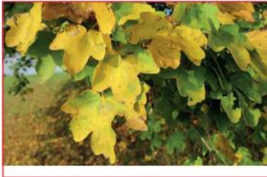
Acer campestre - Veldesdoorn - Herfstbeeld