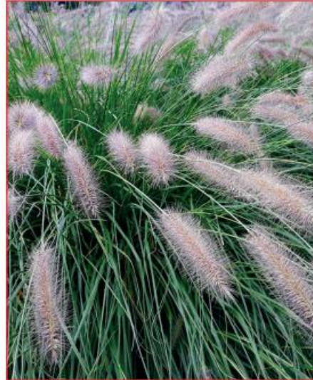
Pennisetum alopecuroides Lampepoetsersgras